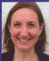
OBERPFALZ - MÜNCHEN